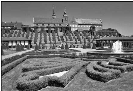
Terrassengarten am Kloster Kamp in Kamp-Lintfort