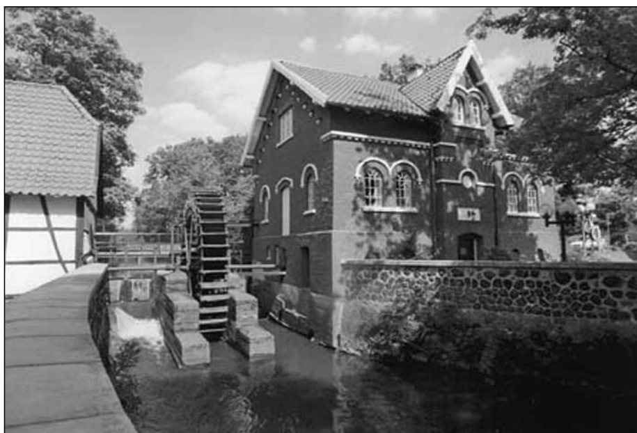
Mühlenmuseum in Dinslaken-Hiesfeld

EILDienst LKT NRW Nr. 12/Dezember 2002 – 10 30-02 –