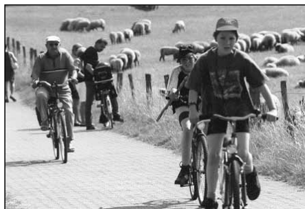
Radfahrer auf dem Rheindeich bei Wesel

Spitzenstellung in NRW ein. Die 1997 geschlossenen Kooperationsvereinbarungen zwischen dem Kreis, den Jägern und der Landwirtschaft gelten als beispielhaft. Sie stellen den Grundsatz: „Erst reden, dann regeln“ in den Mittelpunkt der Landschaftsplanung. Die Landschaftsplanung soll kreisweit 2004 abgeschlossen sein.