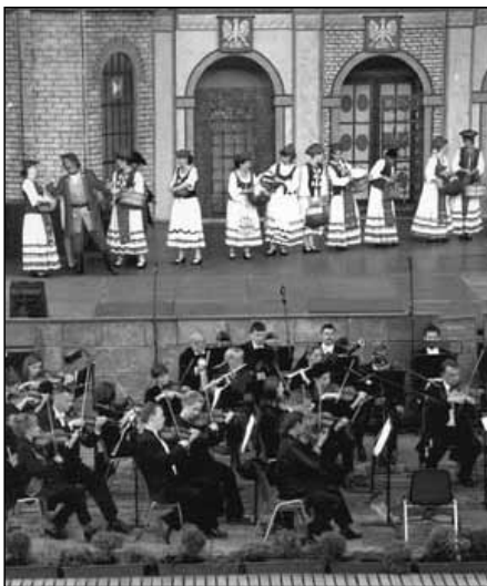
Sommerfestspiele im Archäologischen Park Xanten

Der Kreis Wesel ist nach der kommunalen Neugliederung am 1. Januar 1975 aus Teilen der Kreise Dinslaken, Moers und Rees hervorgegangen. Er umfasst die Ballungsrandzone des Ruhrgebiets mit den Städten Dinslaken, Kamp-Lintfort, Moers, Neukirchen-Vluyn, Rheinberg, Voerde und Wesel. Eher ländlich strukturiert ist das Gebiet der Städte Hamminkeln und Xanten und der Gemeinden Alpen, Hünxe, Schermbeck und Sonsbeck.