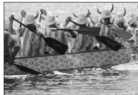
Drachenbootrennen auf dem Xantener Nordsee

Schulen, Volkshochschulen, Weiterbildungseinrichtungen und die Nachbarschaft zur Universität Duisburg sorgen für ein leistungsstarkes Bildungsangebot. Der Kreis Wesel nimmt bei der integrativen Beschulung von behinderten Kindern eine führende Stellung innerhalb des Landes ein. Freie Träger unterhalten einige Bildungs- und Erziehungseinrichtungen, die – wie der Klausenhof in Hamminkeln oder der Erziehungsverein in Neukirchen-Vluyn – einen guten überregionalen Ruf erlangt haben.