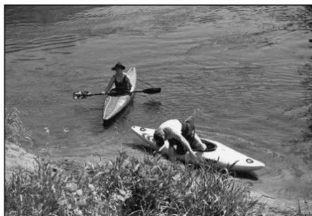
Paddeln auf der Lippe bei Hünxe-Krudenburg

Der Kreis hat die kulturellen Aktivitäten zunächst mit den Kreiskulturtagen und seit