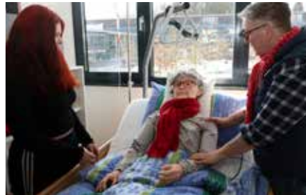
Die AGewiS unterstützt die Woche der Ausbildung der Arbeitsagentur.

enterte Erwachsenenbildung: Lernende erleben realitätsnahe Szenarien, treffen Entscheidungen und reflektieren – statt passiv zuzuhören. Fehler werden als Lern-