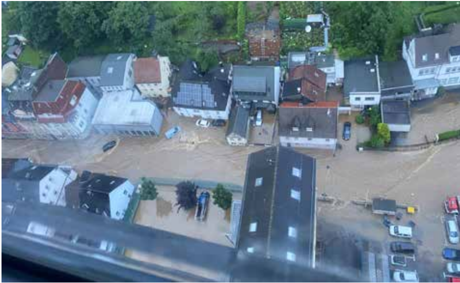
Luftbild von Altena am 15. Juli 2021.