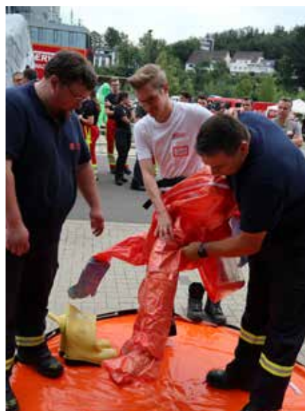
Aktionstag Dekontamination der AGewiS/ Rettungsfachschule.