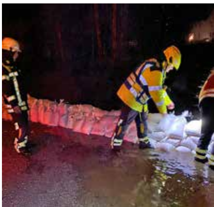
Befüllte Sandsäcke bei einem Hochwasser-Einsatz im Märkischen Kreis.

EILDienst LKT NRW Nr. 5/Mai 2026 10.26.20